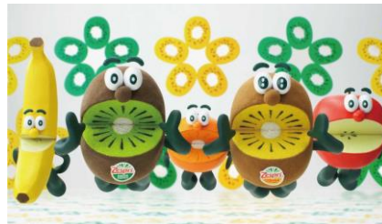
Enjoy the Healthy You Love 好きなことを楽しみながら