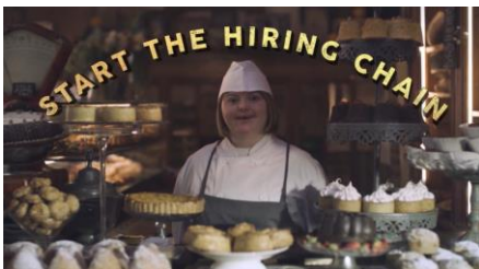
The Hiring Chain 雇用の連鎖