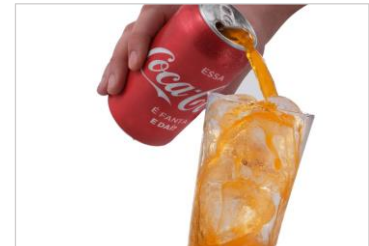
This Coke is a Fanta このコーラはファンタ